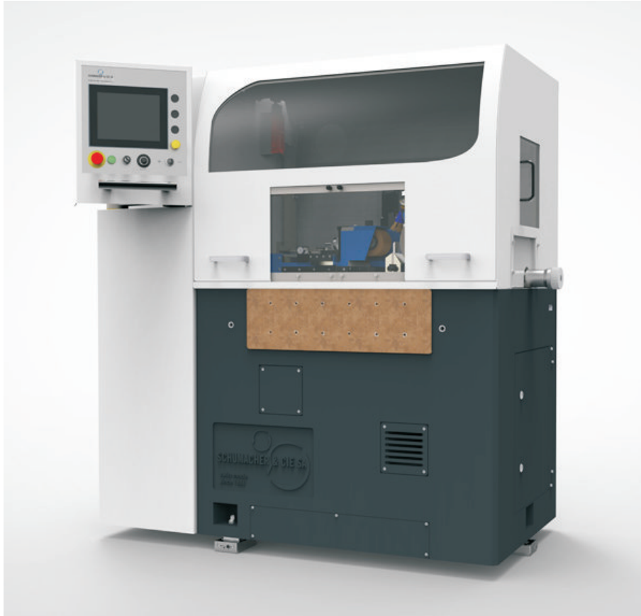
Foto: S200-NC - 1-Achsen-Ausführung